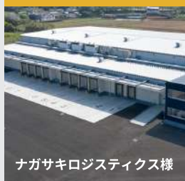
ナガサキロジスティクス様

支援物資を倉庫会社と連携することで、食品など最適温度で管理可能。玄米は、配布会直前に精米してお渡ししています。